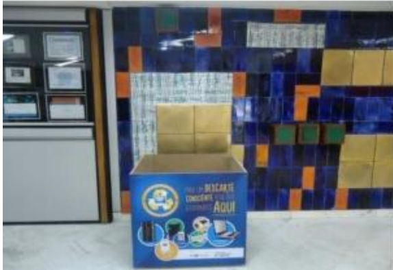
Descarte de Resíduos Eletrônicos